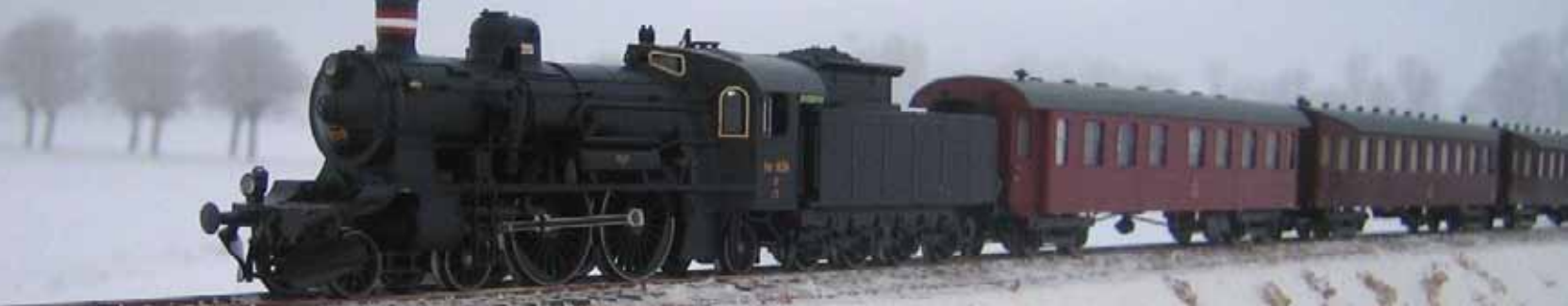
1914: En ung mand er på vej til Brande. Noget stort er i vente.