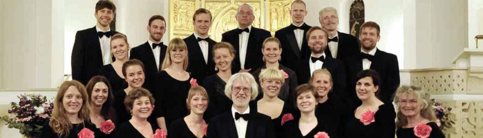
Blaagaard Kammerkor gæster Brande kirke de. 18.april