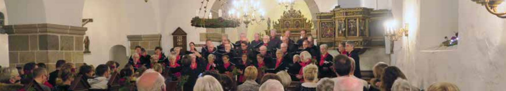
Glæd dig til Den Store Julekoncert med bl.a. kirkekoeret (billedet) d. 12. december.