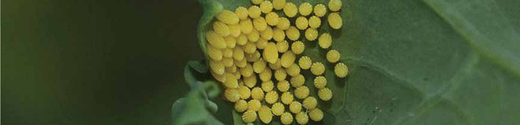
Larver på kålstokke.