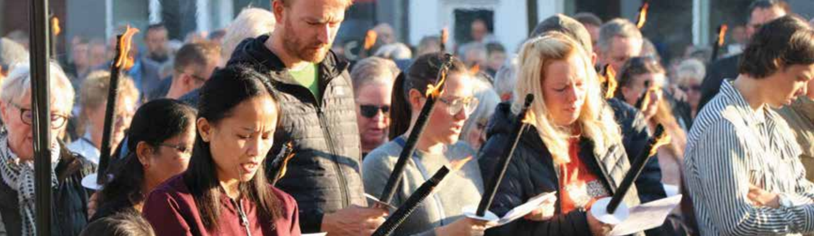
Nedenfor bringes tale og bøn ved Mindehøjtideligheden på Torvet i Brande d. 25. april.