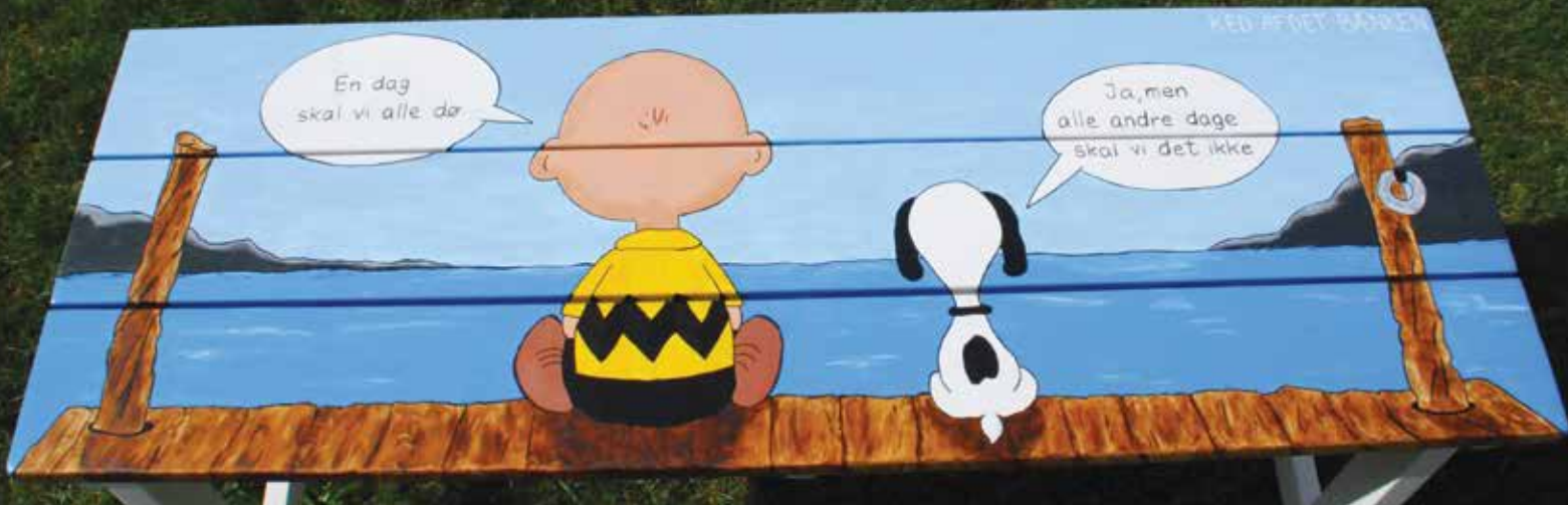
Den seneste bænk i Brande: Ked-af-det-bænken.