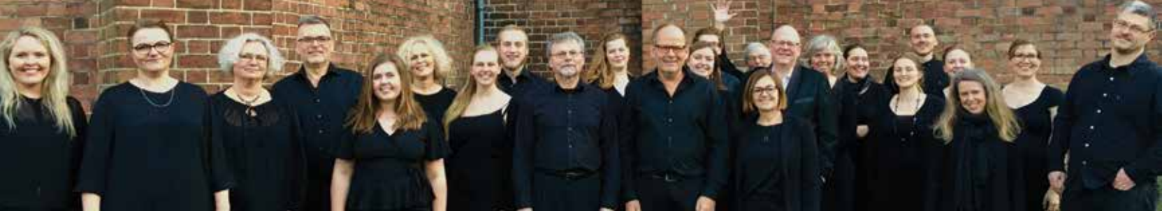
Odense kammerkor gæster Brande kirke d. 2. september.