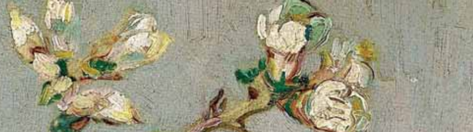
Blomstrende mandelgren – detalje af Van Goghs billede fra 1888.