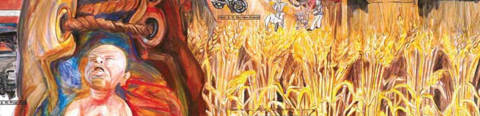
Detalje fra "Esbjergevangeliet" – se side 7.