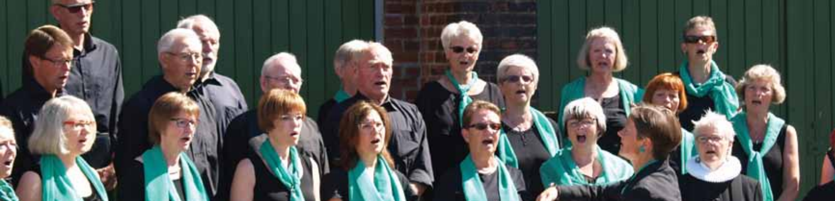
Ved gudstjenesten 2. Pinsedag medvirkede Folkekoret foran Remisen. Ved "Spil-dansk"-dagen d. 30. oktober kan de høres inde i Remisen

I pausen er Uhre Menighedsråd vært ved en kop kaffe.