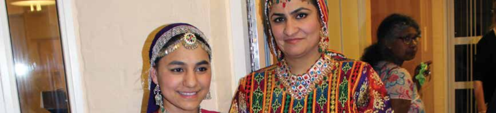
Verdensmiddag d.21.marts - med afghansk, srilankansk og dansk musik og mad.